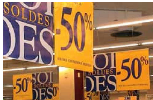
Les soldes débutent aujourd'hui. Elles durent jusqu'au 21 février.

-50 %, parfois – 70 %, jusqu'au 21 février, les prix vont dégringoler : beaucoup en profitent pour acheter des produits de marque à des prix abordables, ou bien font leurs courses de vêtements (mais pas seulement) pour toute la saison.